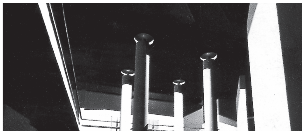
Vista interna al foyer del "Centro per la Musica"